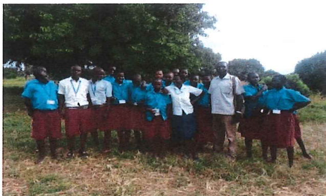
Elever från Loum lågstadieskola i gruppfoto med sin rektor efter tentamen

JLOF Uganda tillhandahöll under 2017 läs- och tentamaterial för att förbereda och stödja både pojkar och flickor inför prov. På tentamensdagarna fick eleverna förutom material även frukost och lunch.